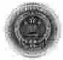
ÜST ÖZETİ Scat sticker (sample) 30mm*30mm